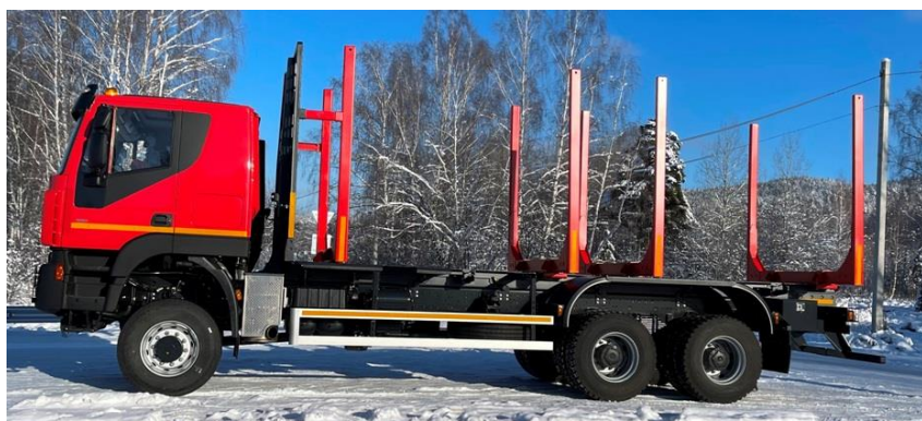
Фотография представлена для ознакомления с общим видом и может отличаться от спецификации!

Направляем Вам коммерческое предложение на поставку в 2023 году сортиментовоза «АМТ NV 632920» (6х6) пр-ва предприятия ООО «АМТ Н.В.». Автомобиль полностью соответствует высоким требованиям и адаптирован к тяжелым дорожным и климатическим условиям.